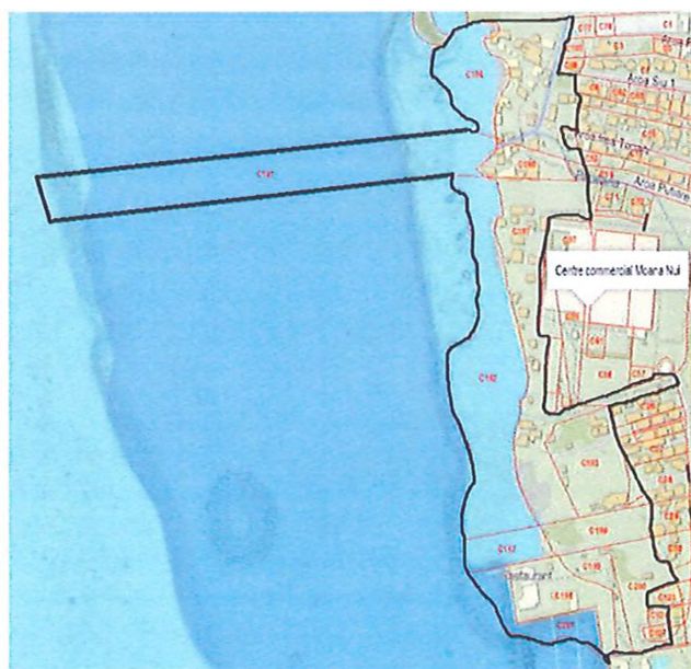
Délimitation de la zone de parcelles n os C25 à C201