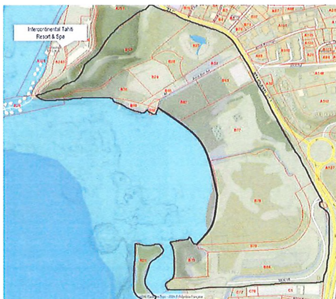
Délimitation de la zone de parcelles n os B15 à B90