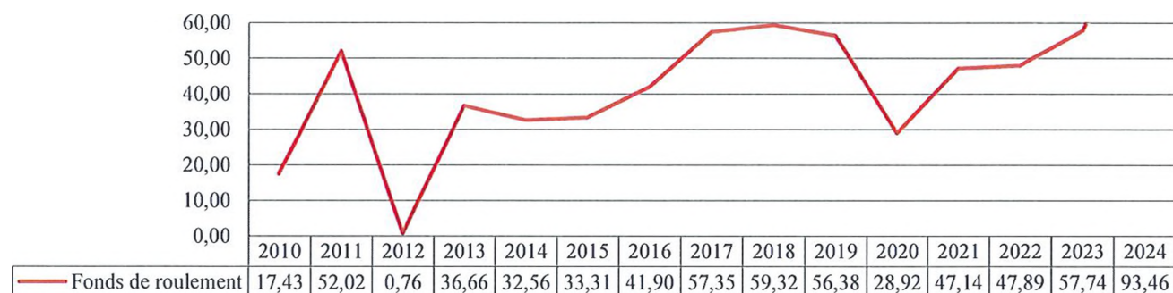
Graphique 6 : Fonds de roulement du CMA entre 2010 et 2024 (en millions de F CFP)

Depuis l'exercice 2010, le fonds de roulement de l'établissement a évolué comme suit :